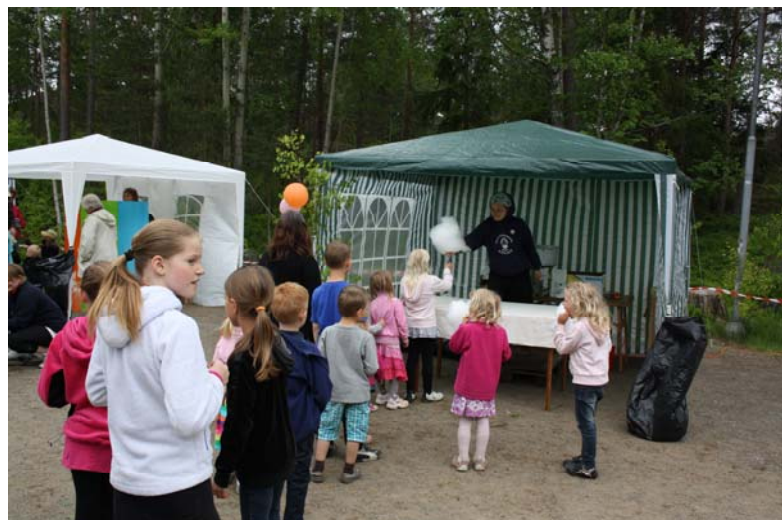
Sockervadden var jättepulär